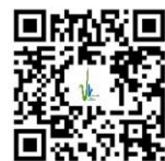
Les Sources Le Bîme (9)