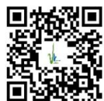
Les Moulins (3) et (10)