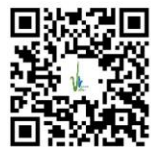
Maison de Justice (7)